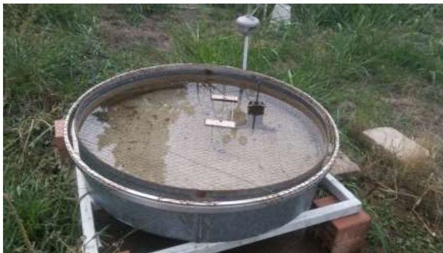
شکل ۲- تشت تبخیر کلاس A مستقر در پردیس دانشگاه

عمق آب کاربردی در هر یک از تیمارها با اندازه‌گیری تبخیر از تشت تبخیر صورت گرفته و با تاثیر ضریب گیاهی نیاز آبی محاسبه گردید. شکل ۲ تشت تبخیر استفاده شده در این تحقیق را نشان می‌دهد که در ایستگاه هواشناسی پردیس دانشگاه علوم کشاورزی و منابع طبیعی گرگان نصب شده است.